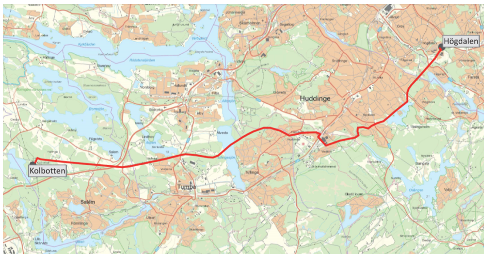
Befintlig sträckning för ledning mellan Kolbotten och Högdalen

För Huddinge kommuns kommande utveckling och människors boendemiljö är det helt avgörande att denna ledning tas bort senast 2023 i enlighet med det avtal som upprättats mellan parterna (KS-2015/924).