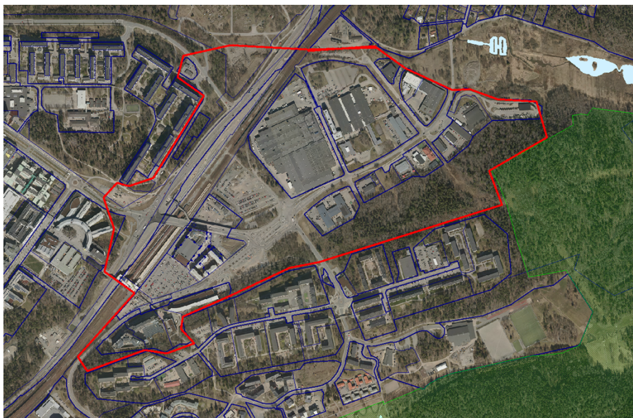
Centrala Flemingsbergs (stadsdelen) ungefärliga utbredning markerat med röd linje

Samtidigt pågår för att nå uppsatta mål utveckling i ett flertal andra mindre områden i Flemingsberg. Utmed Hälsovägen pågår genomförande av ett större exploateringsprojekt med 800 nya bostäder, två förskolor, nya torg och lokaler i bottenvåningen. Inom universitetsområdet pågår byggnation av nya lokaler för forskning, högre utbildning och sjukvård samt planering för student- och forskarbostäder. I Visättra pågår genomförande och planering av ytterligare bostäder och förskolor i ett antal mindre projekt.